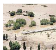
A PAGINA 12 E 13

L'alluvione nel Kashmir India, muore un italiano